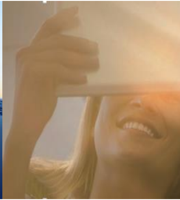
Enfoque hacia el cliente