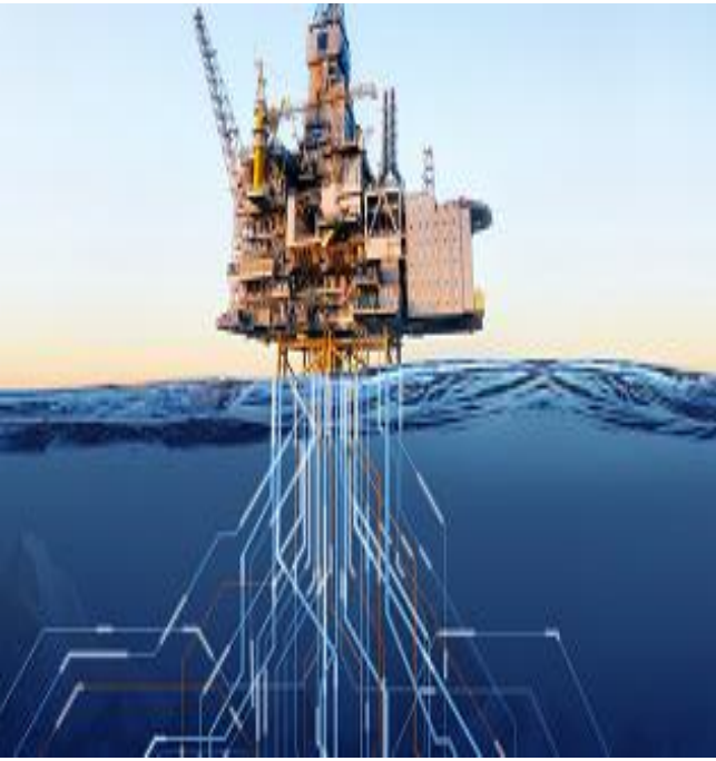
Orientación a la producción